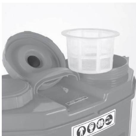
Фильтр (фильтрует осадок в пестицидах)